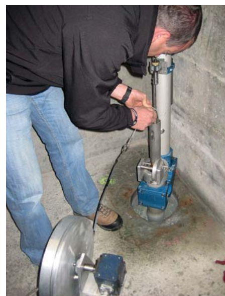
Figure 3. Taking control measurements in the dam.