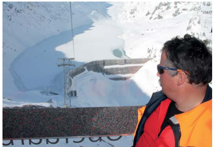
Figure 2. Dam site with access by cable way.