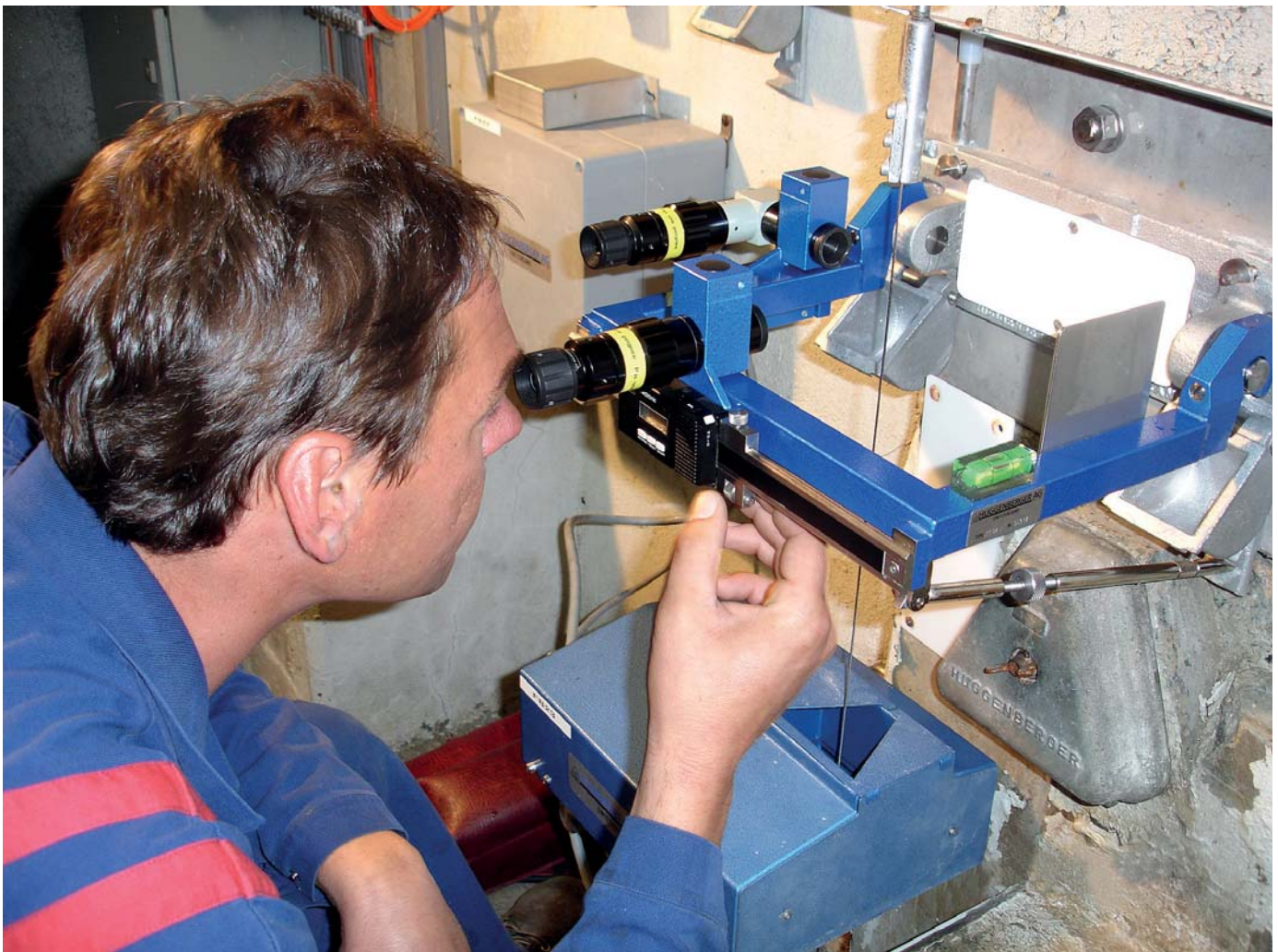
Barragiste en train de faire une mesure de pendule. / Dam warden taking a plumb line measurement.