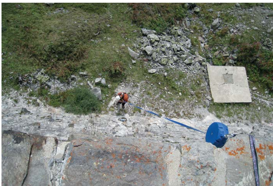
Figure 4. Controlling the dams surroundings.

The anchoring of the measuring bar must be periodically checked.