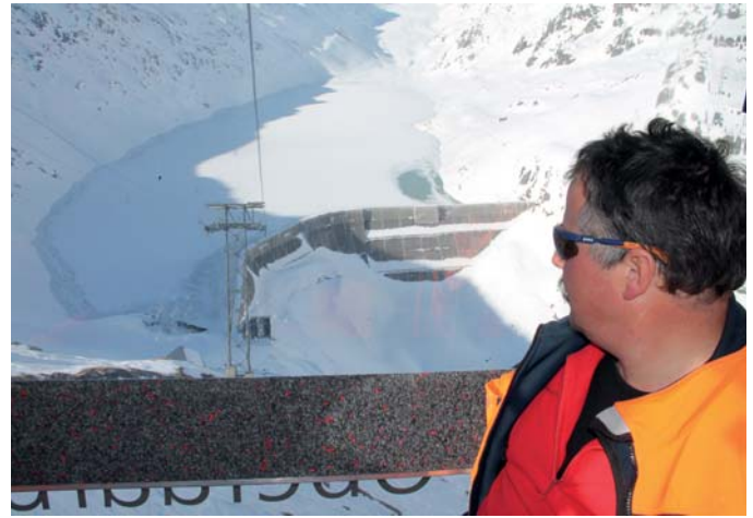
Figure 2. Barrage avec accès par téléphérique.

surveillance de l'ouvrage dans le but d'en assurer le contrôle courant. Cette organisation est consignée dans le règlement de surveillance.