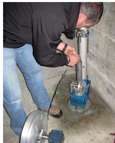
Figure 3. Lecture des instruments de contrôle dans le barrage.

De manière générale, les contrôles visuels ont pour objectif d'observer et de noter tout changement, respectivement toute évolution de l'état du barrage et de ses parties structurelles ou annexes, que ce soit à l'intérieur ou à l'extérieur de l'ouvrage ainsi que dans les environs.