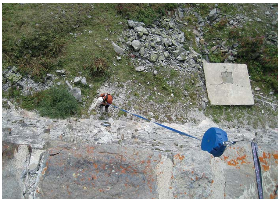
Figure 4. Contrôle des alentours du barrage.