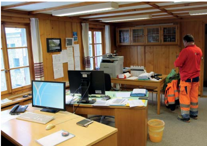
Figure 1. Dam wardens office.